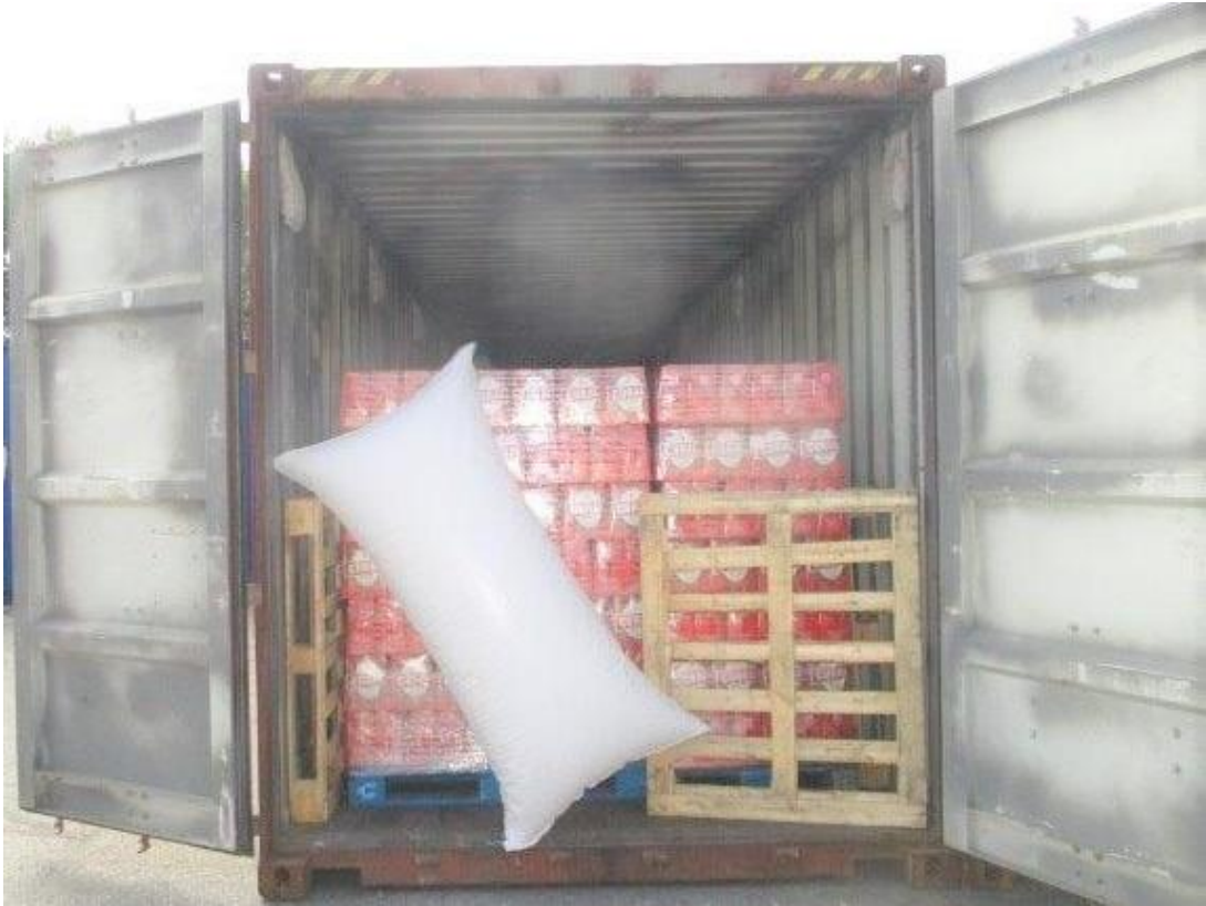
Contentor completo, exportador único