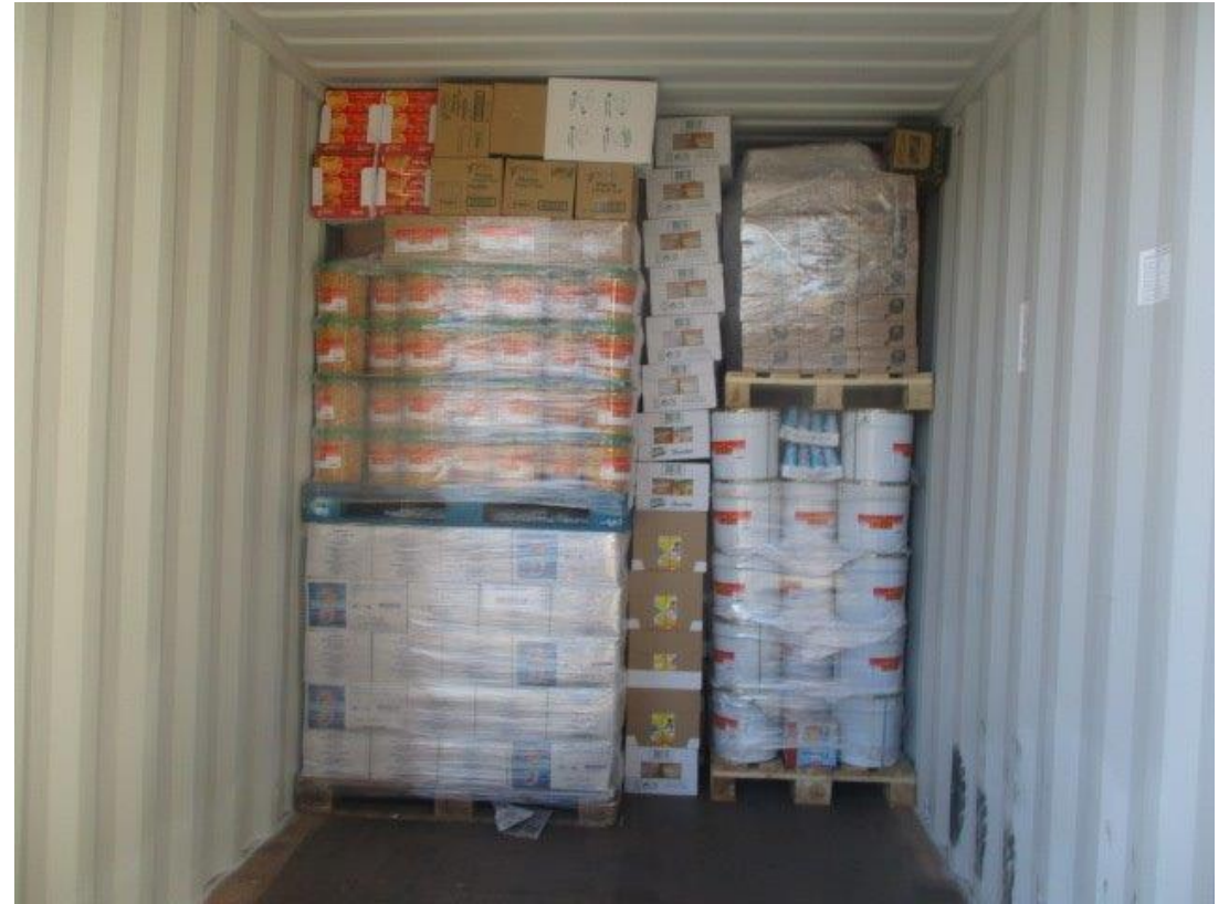
Contentor completo, consolidação