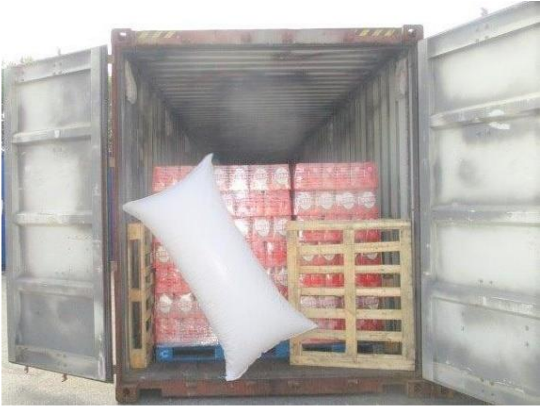
Contentor completo, exportador único